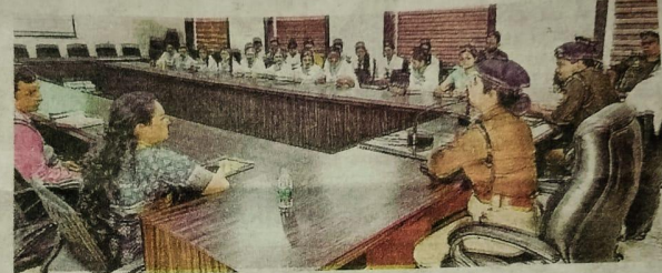
पुलिस लाइंस सभागार में एसपीएएल अभियान के अंतर्गत विद्यार्थियों को जागरूक करती एसपी •